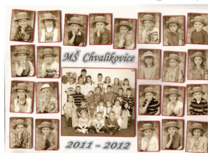
Foto MŠ Chvalíkovice 2011-12

Den matek – svátek maminek oslavíme společně ve Slezském divadle Opava, datum a název představení bude upřesněn v polovině května OÚ.